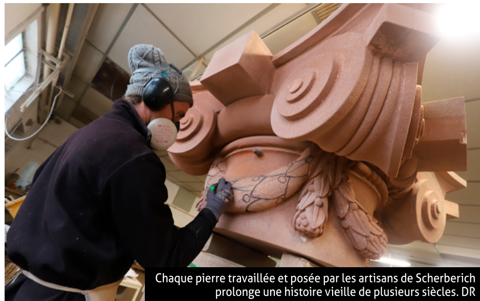
Chaque pierre travaillée et posée par les artisans de Scherberich prolonge une histoire vieille de plusieurs siècles.

« Certains édifices que nous restaurons, nous les connaissons depuis tout petits. Ce sont de véritables rêves pour nous ! » Scherberich Monuments Historiques intervient sur des monuments d'exception entre Belfort et Strasbourg, jusqu'à la limite des Vosges. Scherberich est ainsi intervenu sur la restauration de l'Eglise Notre-Dame à Guebwiller, impliquant la restauration extérieure du chœur et de la sacristie, entre travaux de maçonnerie et pierre de taille. « C'était quatre mois de travail à 25m de hauteur. Nous sommes intervenus sur quatre énormes colonnes dont nous avons remplacé les chapiteaux. » La consolidation du socle du Galtz, aux Trois Epis, la restauration de la tour du clocher de la Collégiale Saint-Thiébaud