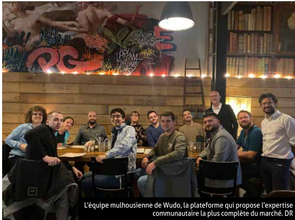
L'équipe mulhousienne de Wudo, la plateforme qui propose l'expertise communautaire la plus complète du marché.

Avec plus de 180 communautés accompagnées (BPI, AFNOR, CETIM, UIMM, Nuclear Valley, ADIRA...), Wudo est le leader de la coopération industrielle et territoriale.