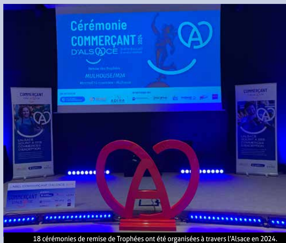
18 cérémonies de remise de Trophées ont été organisées à travers l'Alsace en 2024.

Le "Label Qualité Accueil" proposé depuis 15 ans par la CCI Alsace Euro-métropole évolue et devient « Commerçants d'Alsace ». Une marque soutenue par la Collectivité Européenne d'Alsace. Une marque qui assoit plus que jamais les commerces et les activités de proximité dans leur rôle d'Ambassadeurs de la Marque Alsace.