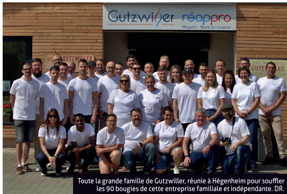
Toute la grande famille de Gutzwiller, réunie à Hégenheim pour souffler les 90 bougies de cette entreprise familiale et indépendante.

Gutzwiller installe tout type de chauffage. « Nous savons tout faire, depuis le fioul, jusqu'à la pompe à chaleur, en passant par le gaz, le bois et le pellet. ». Sur l'exercice 2022/2023, l'entreprise familiale a installé plus de 100 pompes à