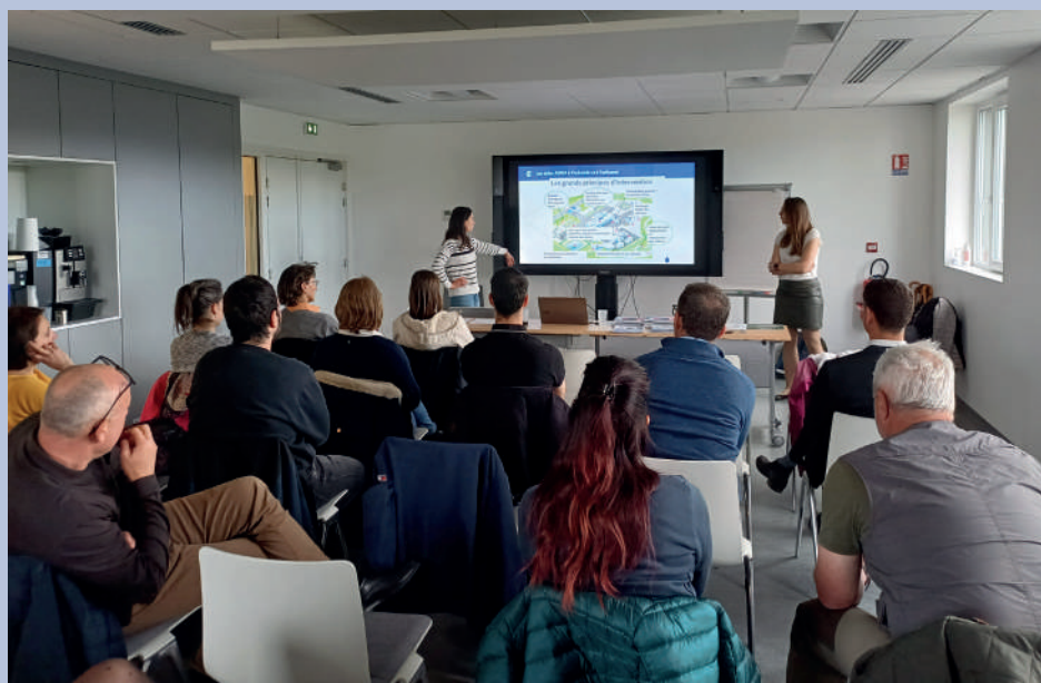
Les ateliers autour de la biodiversité et la végétalisation ont été le point de départ du service d'aménagement durable de la CCI Alsace Eurométropole.

Exploiter le potentiel environnemental des entreprises, par leur aménagement extérieur durable, c'est le service lancé il y a deux ans par la CCI Alsace Eurométropole. Deux personnes sont dédiées à l'élaboration de ces projets pour les entreprises et collectivités.