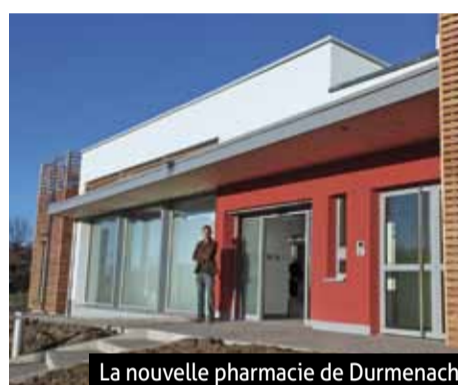
La nouvelle pharmacie de Durmenach