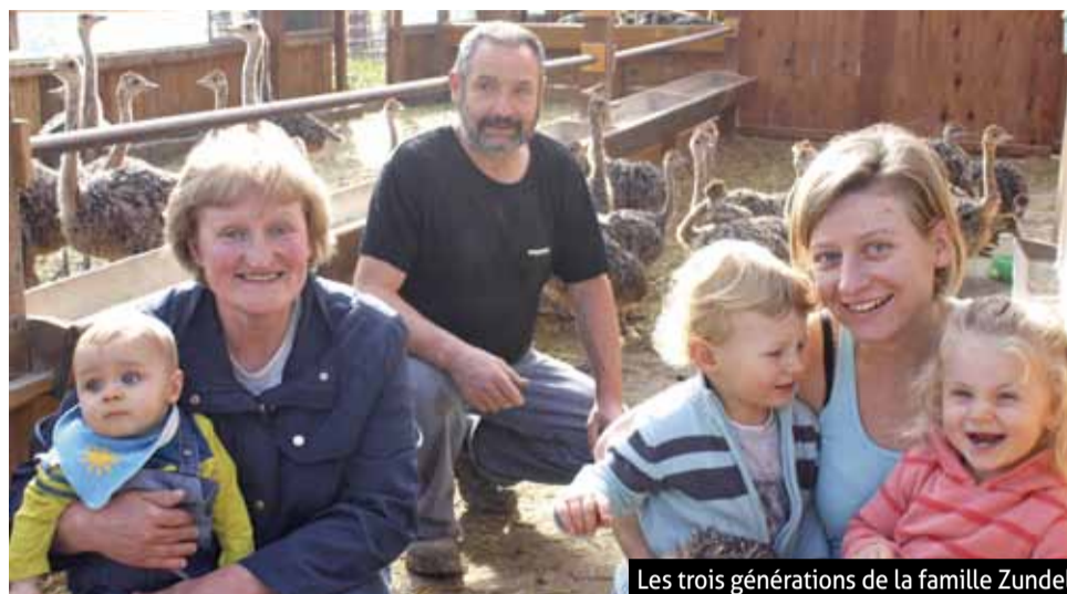
Les trois générations de la famille Zundel