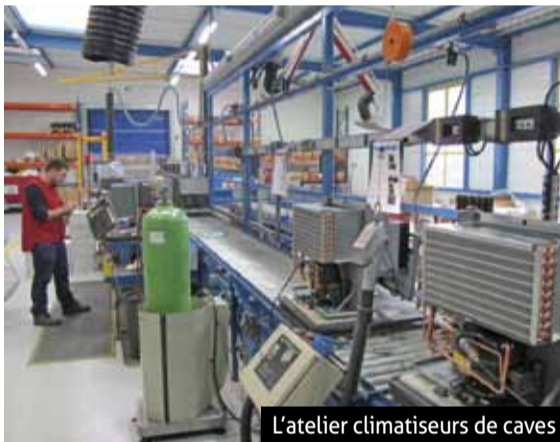
L'atelier climatiseurs de caves