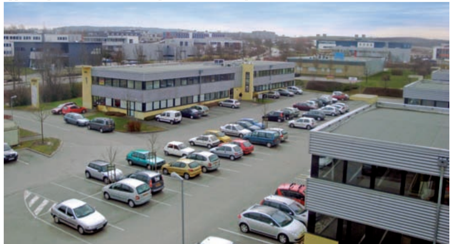
« Entre auto, boulot, courses et dodo, on n'a le temps de rien faire... »

Aujourd'hui, la gratification des salariés ne passe pas forcément par l'octroi d'augmentations, étant donnée la faible visibilité de la conjoncture. Le thème des rétributions alternatives, abordé récemment lors de la première conférence "Yago" au Trident, nous a donné l'idée de ce dossier. Faciliter le quotidien, apporter du confort, diminuer le stress ou favoriser un meilleur pouvoir d'achat sont des avantages appréciés par les salariés... comme par les chefs d'entreprise.