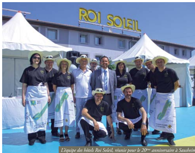
L'équipe des hôtels Roi Soleil, réunie pour le 20 ème anniversaire à Sausheim

■ Contact : Hôtel Roi Soleil ZA Ile Napoléon - CD 201 Sausheim 03 89 61 80 90