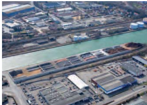
Le Hub Vraquier du site d'Ile Napoléon sera inauguré en septembre 2013

Le trafic étant en augmentation (voir encadré sur les chiffres), les ports améliorent et adaptent en permanence leurs équipements aux besoins du marché. Une grue mobile a ainsi été récemment acquise à Ottmarsheim et un hub vraquier sera prochainement inauguré à Ile Napoléon.