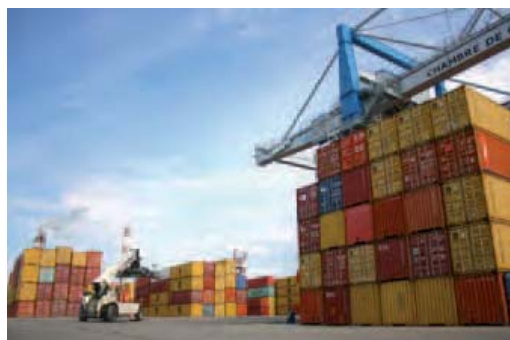
Le terminal «Conteneurs» d'Ottmarsheim est le seul site dédié à cette activité

Les Ports de Mulhouse-Rhin gèrent 110 hectares de terrain qu'ils mettent à disposition des entreprises souhaitant s'implanter à proximité de la voie