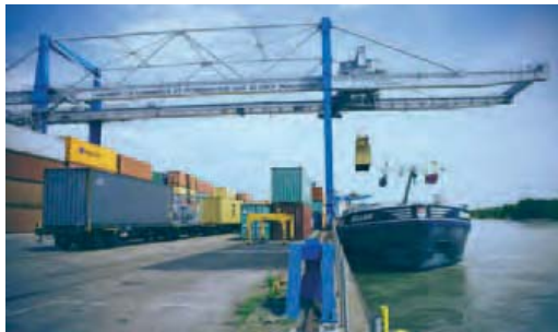
Au-delà de l'exploitation de leurs trois sites, les Ports de Mulhouse-Rhin gèrent les infrastructures et l'aménagement des zones d'activité portuaires

Par ailleurs, les 9 ports du Rhin supérieur sont admis à poser leur candidature au programme RTE-T (réseaux transeuropéens de transport). Le projet consiste à mutualiser leurs services pour offrir un service multimodal plus performant. Il s'agit des ports de Strasbourg, Kehl, Colmar, Mannheim, Ludwigshafen, Karlsruhe et Rheinports.