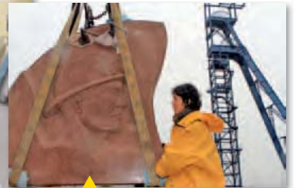
Installation de la sculpture du mineur à Wittenheim