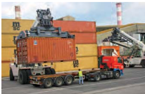
La multimodalité, carte maîtresse des plate-formes portuaires des sites d'Ile Napoléon, de Huningue et d'Ottmarsheim

Les trois ports intérieurs sont de véritables plateformes multimodales qui permettent à la voie d'eau de s'intégrer dans une chaîne de transport, en facilitant les ruptures de charges (transfert des marchandises d'un mode de transport à un autre). Ceci vaut pour le vrac comme pour le conteneur. En reliant le fluvial, le ferroviaire, la route et la mer, les Ports de Mulhouse-Rhin connectent les entreprises importatrices et exportatrices du Sud-Alsace au monde entier.