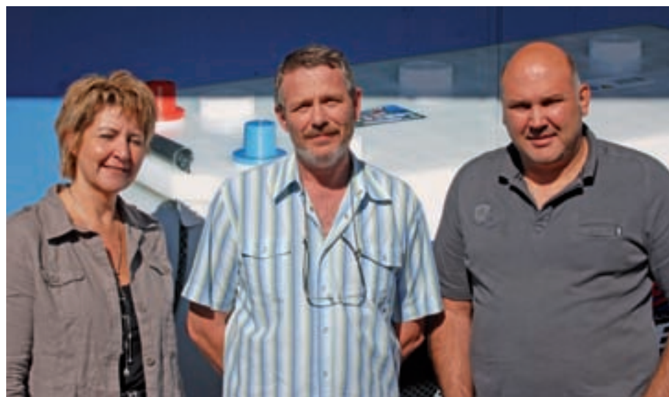
L'équipe de direction France Energie Alsace batteries