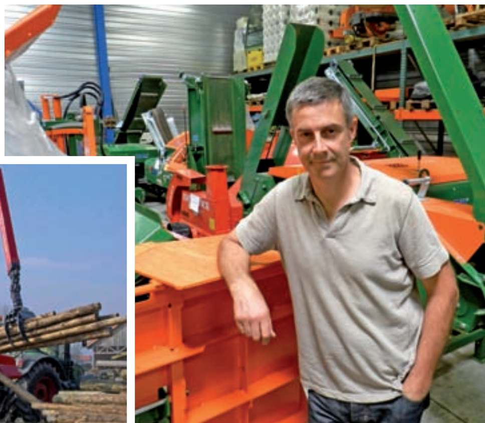
Biber 90 ZK