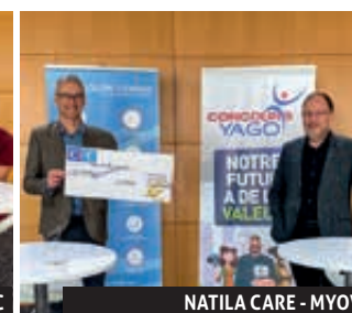
NATILA CARE - MYOV