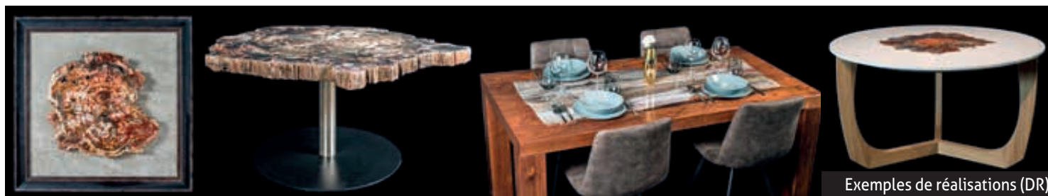
Exemples de réalisations

Goldstein Créations 34 rue d'Ilffurth, Spechbach-le-Bas 03 89 07 06 82 www.goldstein-creations.com f Goldstein Créations @Goldstein_creations