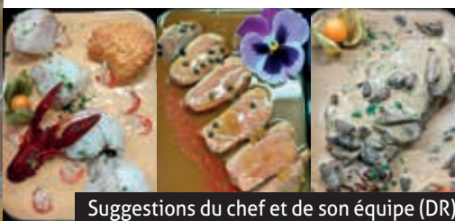
Suggestions du chef et de son équipe