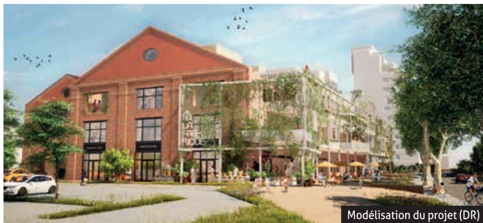
Modélisation du projet (DR)

98 rue de Bâle, Mulhouse lafabrique-mulhouse.fr f La Fabrique