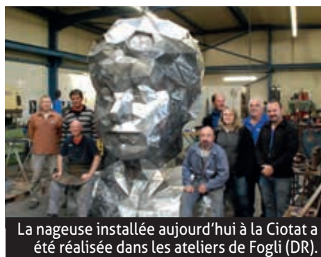
La nageuse installée aujourd'hui à la Ciotat a été réalisée dans les ateliers de Fogli.

Deux ans plus tard, Michel Henn agrandit l'entreprise avec la construction d'un nouveau bâtiment de 300 m². Si le cœur de métier était