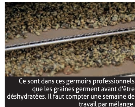
Ce sont dans ces germeurs professionnels que les graines germent avant d'être déshydratées. Il faut compter une semaine de travail par mélange.

Plein d'Vie 3 rue de la Forêt, Kembs pleindvie.com f Green'gnola Pleind'vie