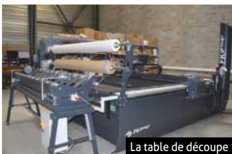
La table de découpe

Final Advanced Materials / FK Europe 4 avenue de Strasbourg, Didenheim 03 67 78 78 78 www.final-materials.com/fr fkgroup.com/fr