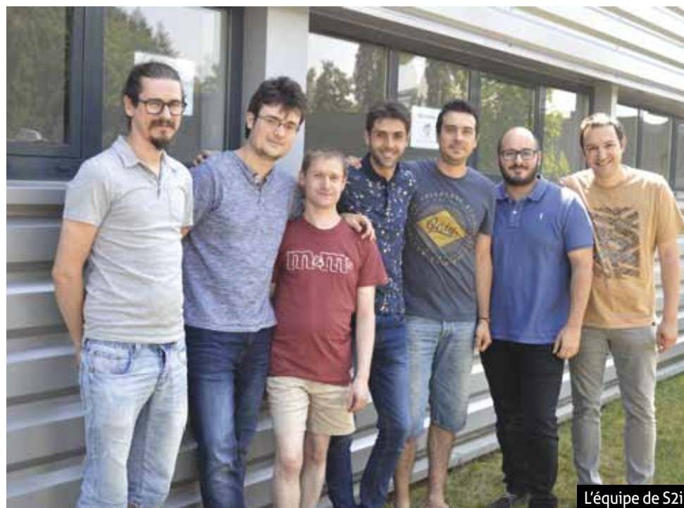
L'équipe de S2i

S2i Evolution 9 avenue de Bruxelles, Didenheim 03 69 67 38 45 www.s2i-agence-web.fr