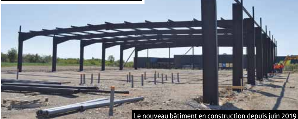
Le nouveau bâtiment en construction depuis juin 2019