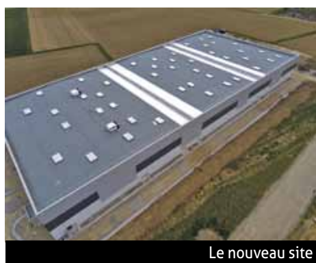
Le nouveau site

Le nouveau site sera équipé de sept quais de chargement qui permettront un flux continu de cargos. Plus de 10 000 palettes pourront être stockées ; c'est trois fois plus qu'à Saint-Louis. Un essor nécessaire pour Agility qui doit faire face au développement de ses nombreux clients implantés en France, en Suisse et à l'international. Alors que le site de Saint-Louis compte vingt collaborateurs, cinq à dix embauches supplémentaires sont à prévoir en 2020 à Blotzheim. L'achèvement des travaux est prévu pour cet été. Le déménagement de l'agence de Saint-Louis devrait s'effectuer à l'automne. L'entreprise continuera de proposer