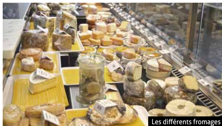
Les différents fromages