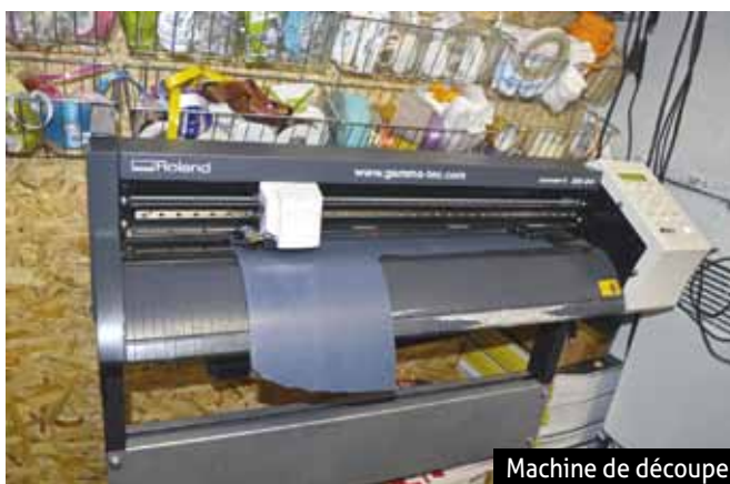
Machine de découpe