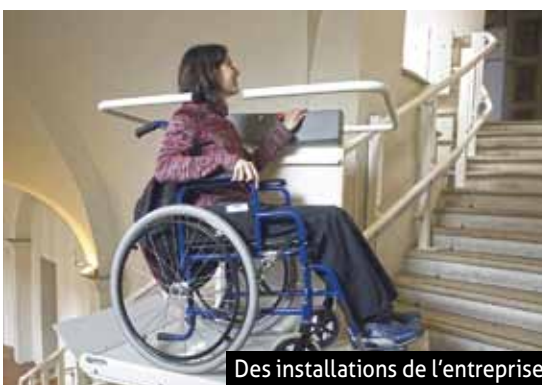
Des installations de l'entreprise