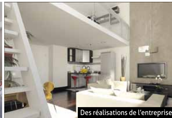
Des réalisations de l'entreprise