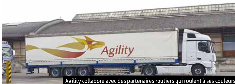
Agility collabore avec des partenaires routiers qui roulent à ses couleurs