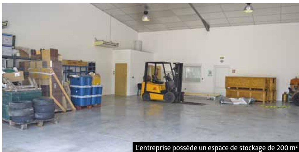
L'entreprise possède un espace de stockage de 200 m²

l'heure, l'objectif est de stabiliser l'activité. Être une petite structure offre beaucoup d'avantages, notamment la souplesse du service ». SPOT possède un espace de stockage de 200 m² dont Nicolas Pottier voudrait davantage exploiter le potentiel. « Je propose à mes clients de stocker et de gérer informatiquement leur marchandise, mais je peux également proposer du stockage ponctuel pour le compte d'un particulier ou d'une entreprise qui ferait une grosse commande et aurait besoin de l'entreposer. Nous sommes ensuite en mesure