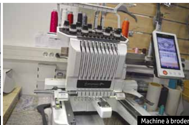
Machine à broder

DES CONSEILLERS QUI PARLENT LE LANGAGE DES ENTREPRENEURS ÇA CHANGE TOUT !