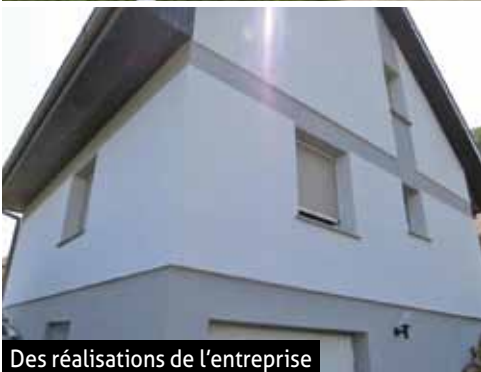
Des réalisations de l'entreprise