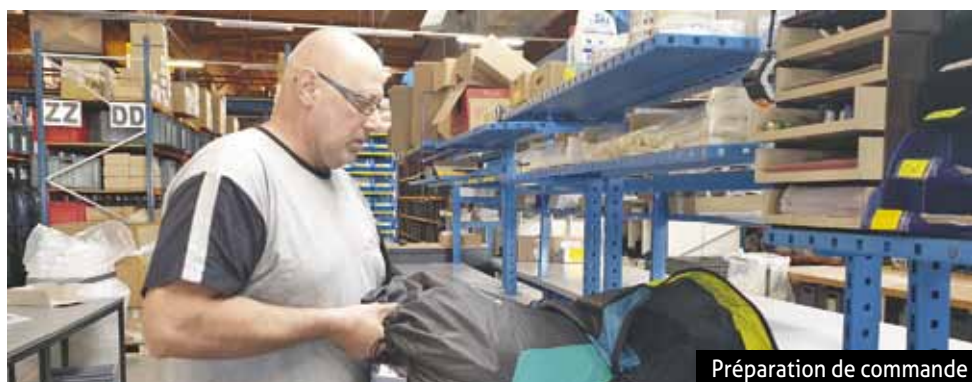
Préparation de commande