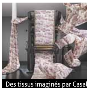
Des tissus imaginés par Casal

développer davantage nos collaborations en local ». Sur ces cinq dernières années, l'entreprise a réalisé quatre embauches. « Et cela devrait continuer, avec une personne supplémentaire pour renforcer l'équipe de