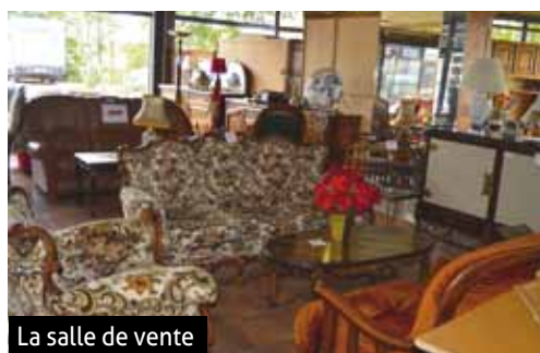
La salle de vente

27 faubourg de Mulhouse, Kingersheim 03 89 43 49 12