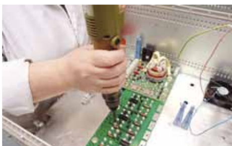
Scaita assure pour ses clients l'intégration de sous-ensembles

2 place Thierry Mieg, Vieux-Thann 03 89 37 70 37 www.scaita.eu