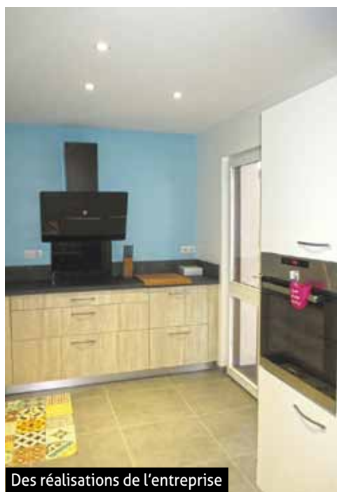
Des réalisations de l'entreprise

La majeure partie de la clientèle de La Palette d'Eric est composée de particuliers. « Nous travaillons également avec des professionnels, syndicats, collectivités... Nous sommes déjà intervenus dans des écoles, mairies, églises, etc. ». L'entreprise se déplace dans le Haut-Rhin et sur le Territoire de Belfort. En 2018,