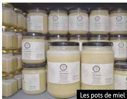
Les pots de miel