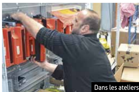
Dans les ateliers