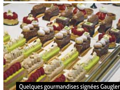
Quelques gourmandises signées Gaugler