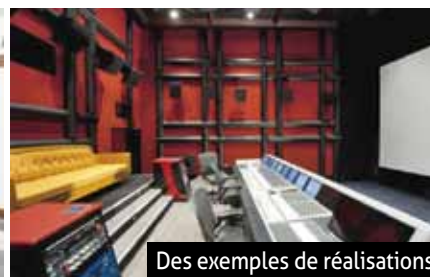
Des exemples de réalisations