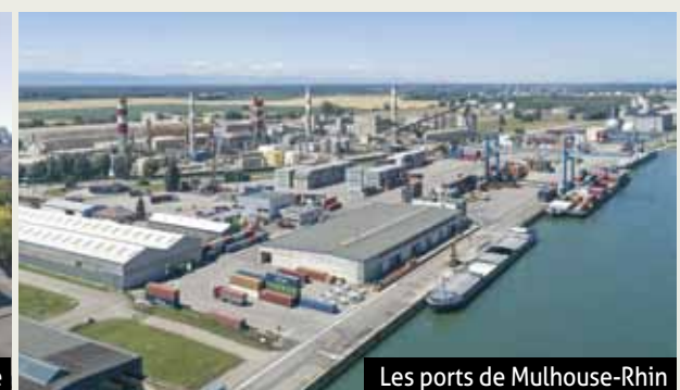
Les ports de Mulhouse-Rhin