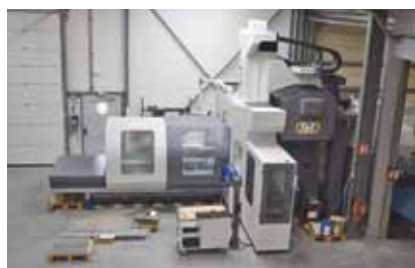
Vue sur les ateliers