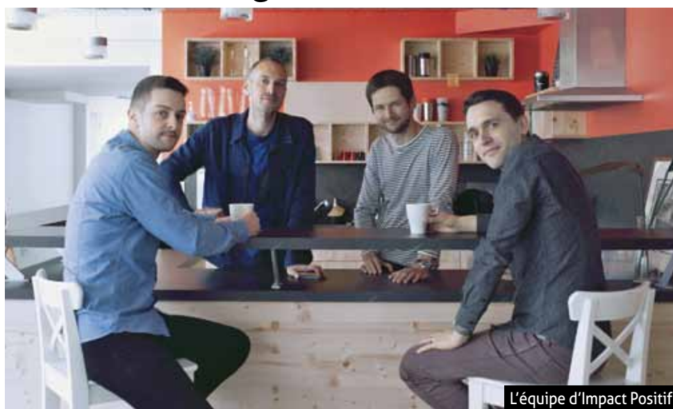
L'équipe d'Impact Positif