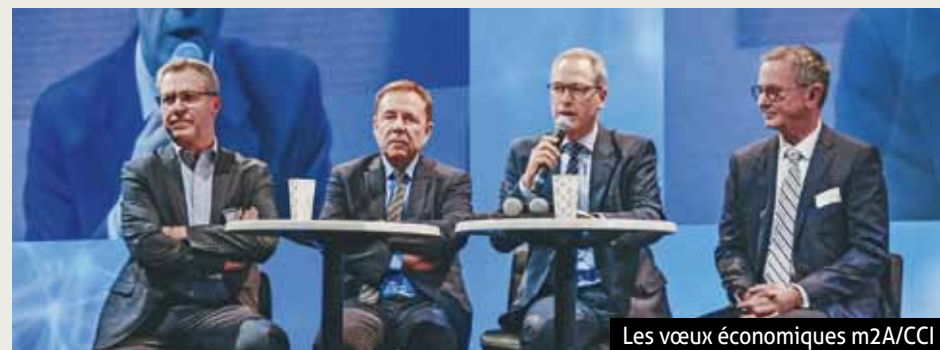
Les vœux économiques m2A/CCI

Territoire résolument "pro business", Mulhouse Alsace Agglomération agit aujourd'hui sur tous les fronts et s'affirme plus que jamais comme l'interlocuteur économique privilégié des entreprises dans leurs projets économiques de création, de développement ou d'implantation.