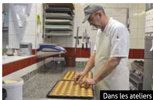
Dans les ateliers