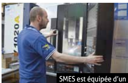
SMES est équipée d'un parc-machine à la pointe de la technologie