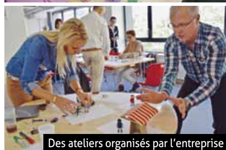
Des ateliers organisés par l'entreprise