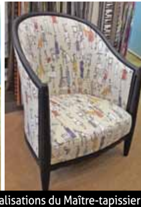
Des réalisations du Maître-tapissier