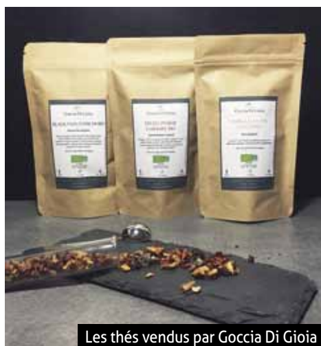
Les thés vendus par Goccia Di Gioia