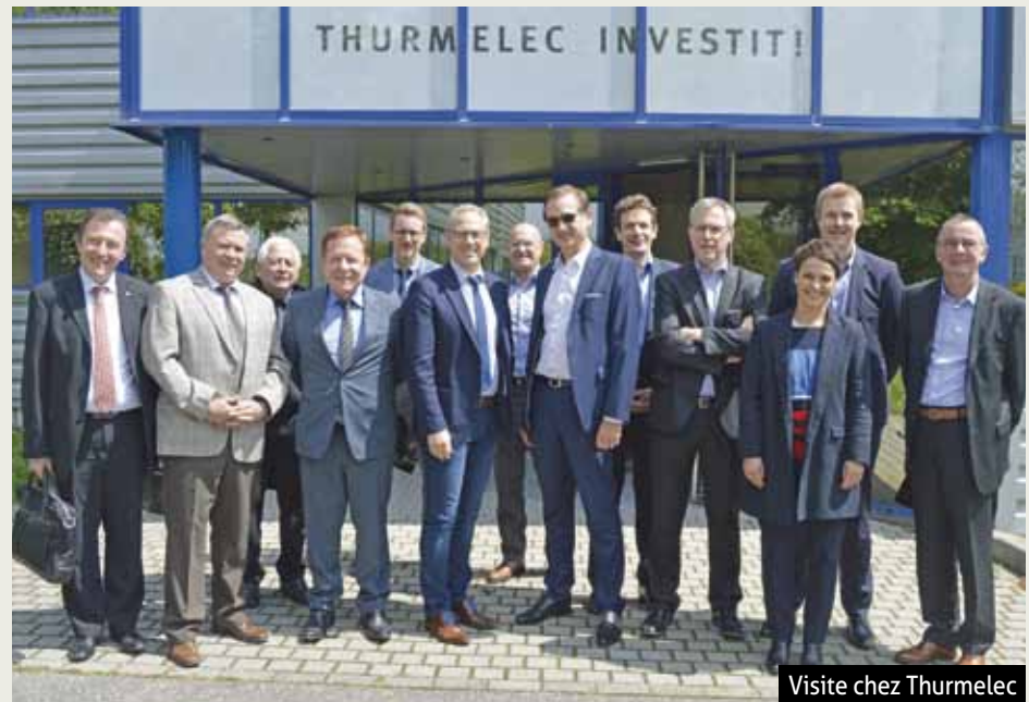
Visite chez Thurmelec

La problématique du recrutement est un thème revenant régulièrement lors de ces visites, notamment dans les industries. m2A a donc pour mission de donner de l'appétence à ces métiers ayant une mauvaise connotation. Elle était notamment présente au French Fab Tour qui s'est arrêté le 20 mai à Mulhouse. Il s'agit d'une tournée de 60 dates à travers la France destinée à promouvoir l'industrie, susciter des vocations chez les jeunes, proposer des offres d'emploi et co-construire l'industrie de demain. m2A soutient également le KidsLab, un lieu de rencontres pour les 7-17 ans autour du numérique, de la programmation, de la robotique et des sciences. Elle est partenaire du Challenge Industrie Mulhouse, car elle se veut être une passerelle entre le monde universitaire et celui des entreprises. Elle aide au recrutement en faisant le lien entre recruteurs et organismes de formation, lycées professionnels, etc. m2A propose d'adapter les formations et de former aux métiers de demain afin de répondre et d'anticiper les besoins des entreprises. Une réflexion est pour cela menée avec des organismes tels que l'association Sémaphore ou la MEF Mulhouse Sud Alsace.