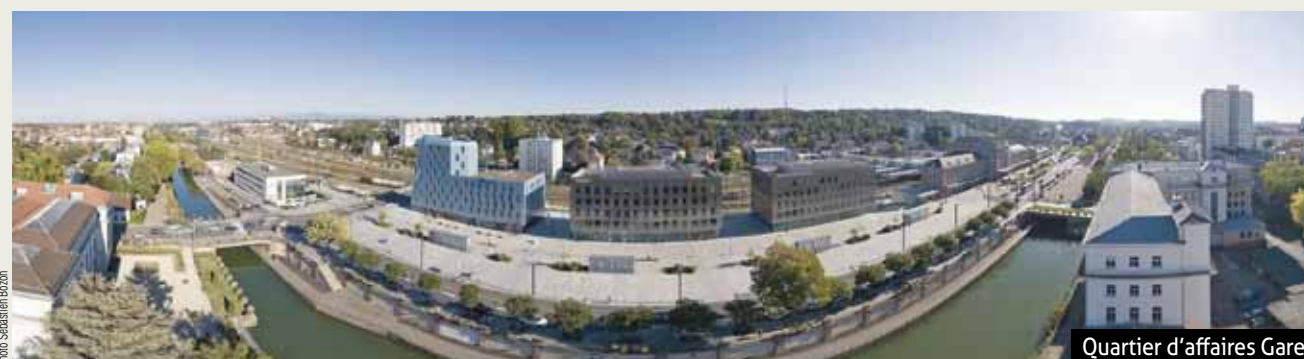
Quartier d'affaires Gare

Dès 2013, m2A a mis en place le cluster territorial, Campus Industrie 4.0 regroupant les entreprises du Sud Alsace, l'Université de Haute Alsace (UHA), le Technopole Mulhouse, la CCI, mais aussi des incubateurs et le CETIM Grand Est. Il a pour objectif de booster la compétitivité des entreprises industrielles du territoire, de promouvoir les talents, faire émerger de nouveaux projets et rayonner à l'échelle internationale. Autre projet d'envergure : le lancement du KMØ. Situé dans le quartier de la Fonderie à Mulhouse, ce nouvel écosystème allie recherche, emploi et formation. Il est ouvert aux entreprises industrielles et du numérique, startups, chercheurs, entrepreneurs, artistes, étudiants, formateurs, investisseurs, associations... de France, d'Allemagne et de Suisse, pour capitaliser sur la richesse des dynamiques transfrontalières. En 2020, c'est la Maison de l'Industrie qui ouvrira ses portes dans ce même quartier. Elle regroupera les services de l'Union des Industries et Métiers de la Métallurgie (UIMM) et accueillera une nouvelle usine-école (FORMLAB). L'objectif est de développer une offre de formations innovantes