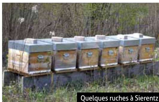
Quelques ruches à Sierentz