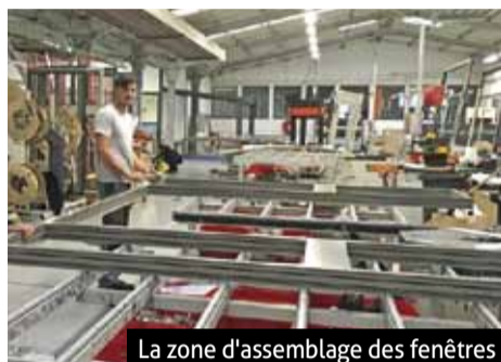
La zone d'assemblage des fenêtres

En 1976 Natale Vitale, épaulé par son fils César, débute une activité d'artisan-poseur spécialisée dans la fermeture. Les Fermetures Vitale voient le jour en 1990 avec la production, en 1992, de premières fenêtres en PVC. Aujourd'hui, l'entreprise fabrique et installe des portes et des fenêtres en PVC et en aluminium de très haute qualité.