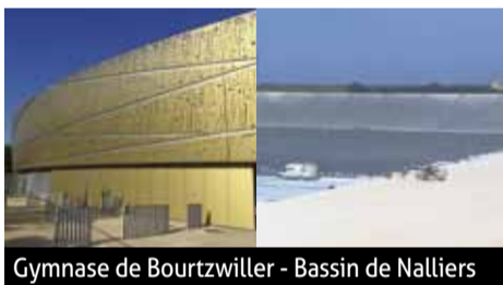
Gymnase de Bourzwiller - Bassin de Nalliers

L'entité historique de Galopin consiste en l'étanchéité des bâtiments réalisés avec des rouleaux en PVC ou en bitume. Sa clientèle : des grands noms de la distribution ainsi que des industries de la région. La seconde entité, EGC Galopin, se consacre au bardage en façade métallique, en bois et en panneaux composites : « Nous intervenons sur les ouvrages d'art tels que les autoroutes, les lignes TGV, les décharges et d'autres travaux publics », précise le gérant.