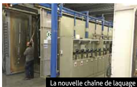
La nouvelle chaîne de laquage

Historiquement, PEA est une entreprise spécialisée dans les clôtures, portails, balustrades et claustras. Rachetée par Corinne Vogt et Philippe Cece en 2011, la société développe son cœur de métier et se lance depuis deux ans dans la fabrication de fenêtres et portes en PVC et en aluminium. L'entreprise compte aujourd'hui 20 employés, tous corps de métiers confondus.