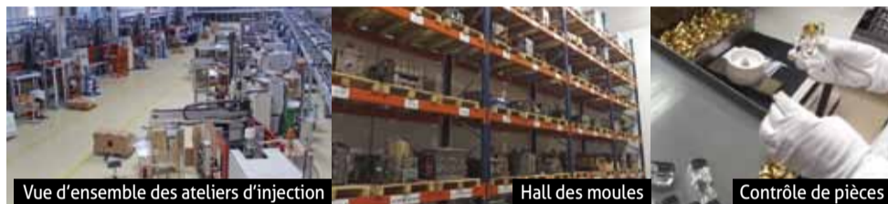
Vue d'ensemble des ateliers d'injection

SAF possède une salle entière équipée des moules de l'entreprise, depuis sa création. L'une des contraintes du métier est la disparition des fabricants français de moules : « En France, il y a encore des moulistes en Bretagne, et bien sûr en Allemagne, mais ils sont très chers car ils