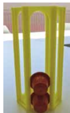
Support de dosette compatible Nespresso. Modèle déposé et étudié avec Black and Tea

L'atelier propose des pièces imprimées de toutes sortes : objets ludiques, support pour flyers ou mobiles, portes clés, outillages, objets publicitaires/décoratifs, pièces de jonctions pour profilés, pièces techniques... dont les dessins peuvent être créés en interne.