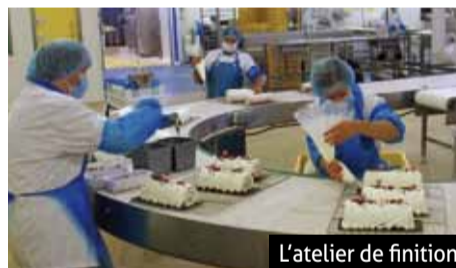
L'atelier de finition

A la fois espace de vente, salon de dégustation et espace de démonstration pour la fabrication de desserts, ce point de vente Erhard Pâtissier Glacier s'adresse pour la première fois au particulier en direct, avec quelque 650 références, 200 parfums de glaces et 70 entremets glacés, à tous les niveaux de prix, gamme ou quantité selon l'usage voulu. Conçu selon un design innovant, ce point