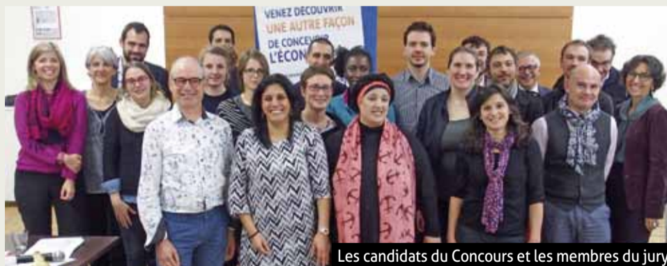
Les candidats du Concours et les membres du jury

Après un débat animé, vu leur pertinence, ce sont 5 projets au lieu de 4 qui ont été retenus :