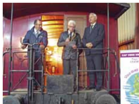
Présentation du programme Leader par les Elus au dépôt du train de la Doller

Contact : Pays Thur-Doller 5 rue Gutenberg, Vieux-Thann 03 89 35 70 96 leader@pays-thur-doller.fr