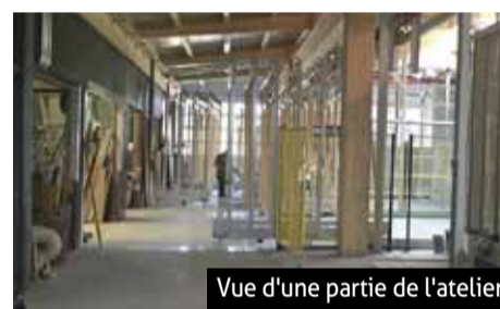
Vue d'une partie de l'atelier

Les portes, portes coulissantes et fenêtres sont intégralement fabriquées sur site avec des profilés en bois conçus sur mesure. La société propose également à ses clients des brise-soleils, des volets roulants et des stores. Si ces produits ne sont pas fabriqués sur place, ils sont d'excellente qualité et la pose est assurée par l'entreprise.