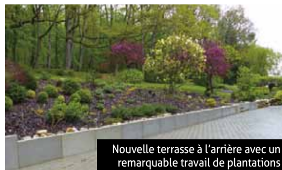
Nouvelle terrasse à l'arrière avec un remarquable travail de plantations

L'Auberge Sundgovienne 1 route de Belfort à Carspach 03 89 40 97 18 www.auberge-sundgovienne.fr