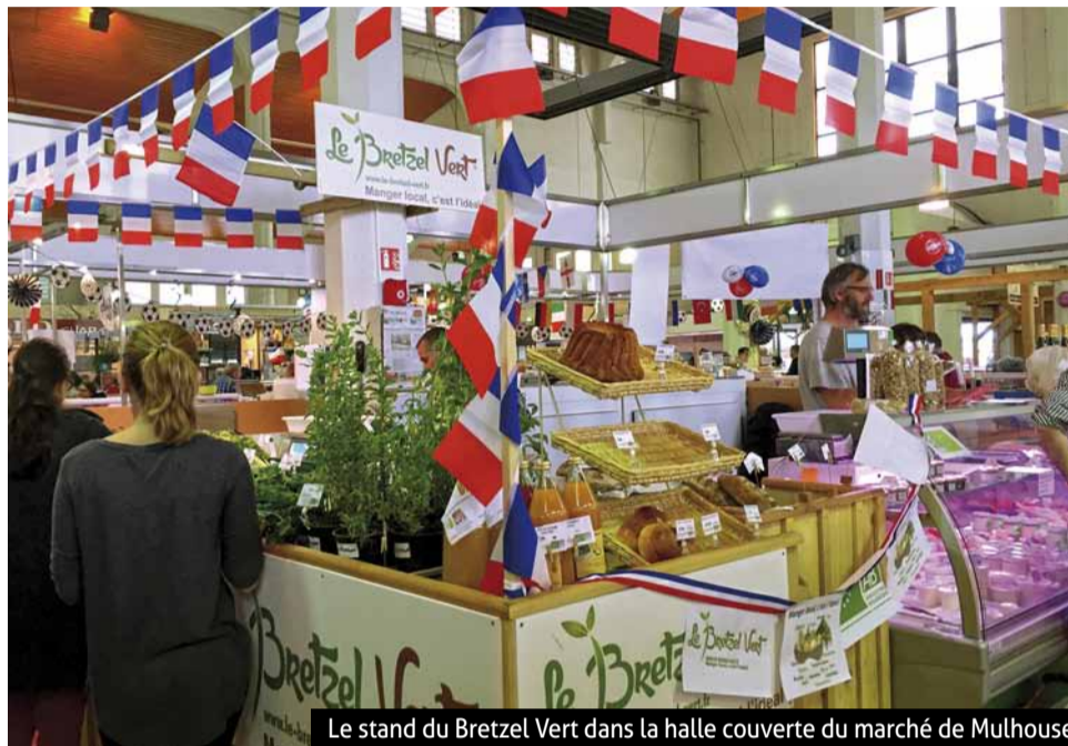
Le stand du Bretzel Vert dans la halle couverte du marché de Mulhouse

Depuis avril 2016, un GIE de 13 producteurs de pain, fruits, légumes, poulets, charcuterie, produits traiteur, produits laitiers, vins de jus de fruits gère un stand commun dans la halle couverte du marché de Mulhouse.