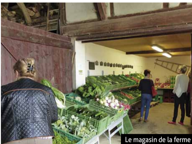
Le magasin de la ferme

production de leurs légumes. La Ferme Fischer livre également quelques produits au Super U de Riedisheim, au restaurant la Cant'In et à la Brasserie Flo.