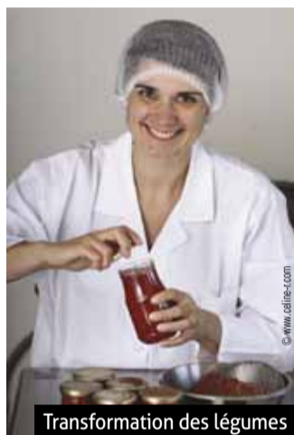
Transformation des légumes