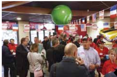
Inauguration de la franchise le 23 mai dernier en présence de tous les partenaires et fournisseurs

Papa John's - siège France, atelier et magasin 30 rue de Guebwiller à Kingersheim 03 89 55 22 22 www.papajohns.fr