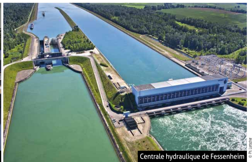
Centrale hydraulique de Fessenheim