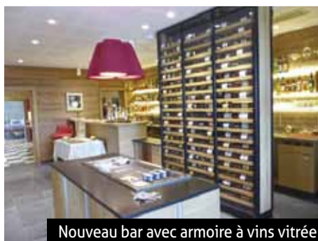
Nouveau bar avec armoire à vins vitrée