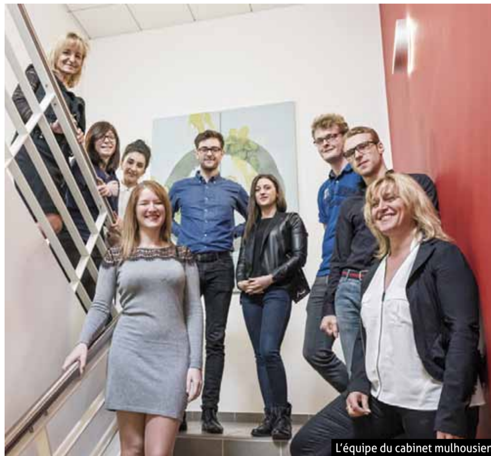
L'équipe du cabinet mulhousien

Activ / RH Recrutement - Approche Directe