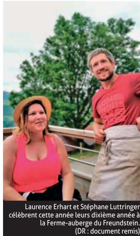
Ferme-auberge du Freundstein Willer-sur-Thur 03 89 82 31 63 f Ferme-Auberge du Freundstein