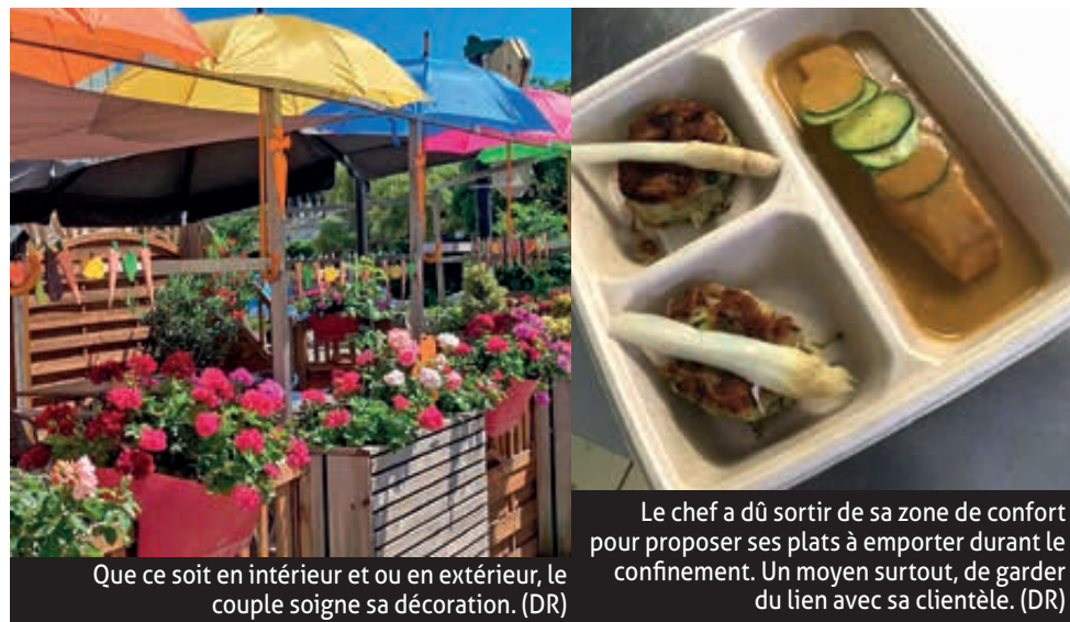
Que ce soit en intérieur et ou en extérieur, le couple soigne sa décoration. (DR)