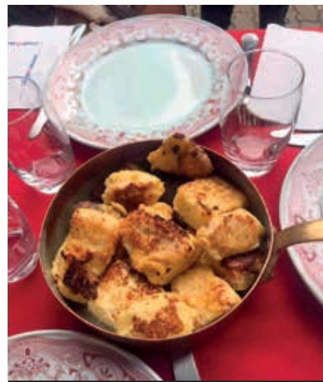
Le mercredi, retour aux saveurs d'antan avec les Griespfluttas à emporter. Un plat traditionnel qui a connu un franc succès

Winstub Henriette 9 rue Henriette - Mulhouse 03 89 46 27 83 www.winstub-henriette.com f Winstub Henriette