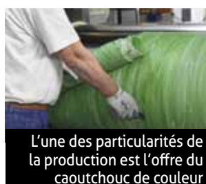
L'une des particularités de la production est l'offre du caoutchouc de couleur

SES-Sterling 1 bis rue de Delémont à Saint-Louis 03 89 70 20 11 www.ses-sterling.com