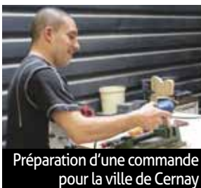
Préparation d'une commande pour la ville de Cernay