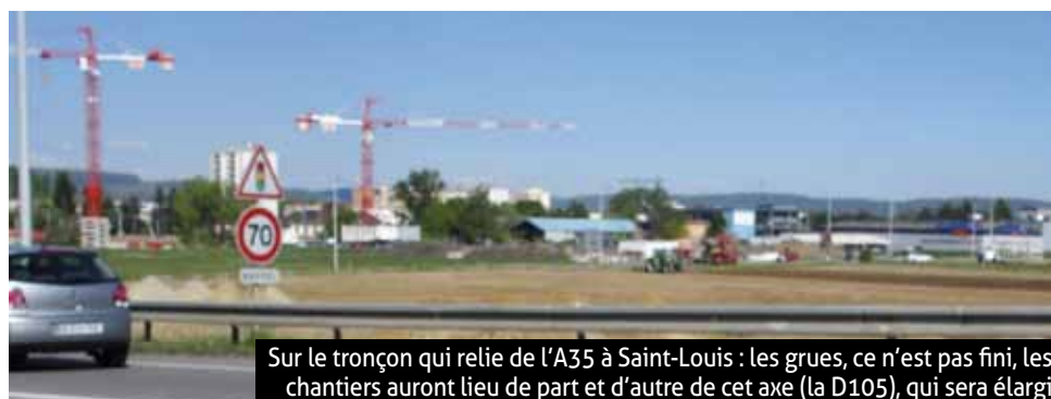
Sur le tronçon qui relie de l'A35 à Saint-Louis : les grues, ce n'est pas fini, les chantiers auront lieu de part et d'autre de cet axe (la D105), qui sera élargi