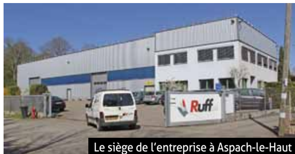
Le siège de l'entreprise à Aspach-le-Haut