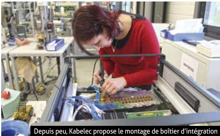
Depuis peu, Kabelec propose le montage de boîtier d'intégration