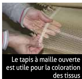
Le tapis à maille ouverte est utile pour la coloration des tissus