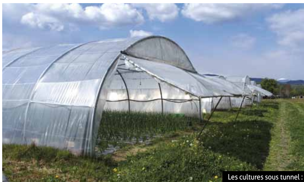
Les cultures sous tunnel :

(qui produit du fromage et de la viande bio), ainsi qu’à un groupe de producteurs à Wesserling. « Nous avons atteint le bon rythme et c’est bien ainsi », conclut une maraîchère heureuse.