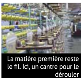
La matière première reste le fil. Ici, un cantre pour le dérouler