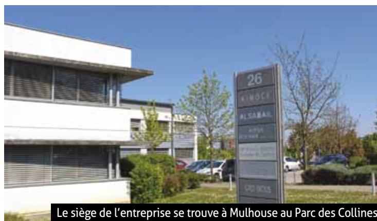
Le siège de l'entreprise se trouve à Mulhouse au Parc des Collines