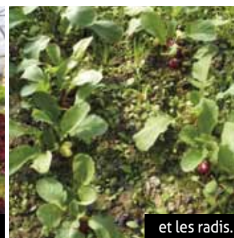
et les radis.