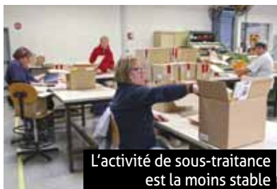
L'activité de sous-traitance est la moins stable