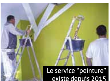
Le service "peinture" existe depuis 2015

37A rue des Pèlerins à Thann 03 89 37 38 67 www.aufildelavie.fr/esat-de-rangen