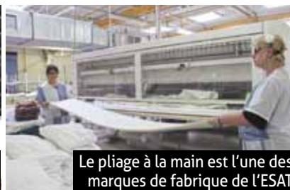
Le pliage à la main est l'une des marques de fabrique de l'ESAT