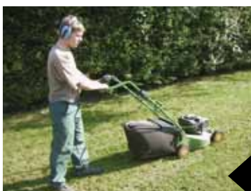
L'entretien des espaces verts est un des secteurs historiques de l'ESAT