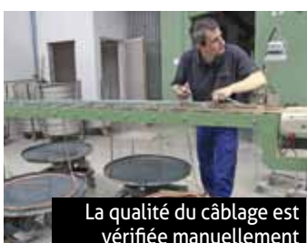
La qualité du câblage est vérifiée manuellement