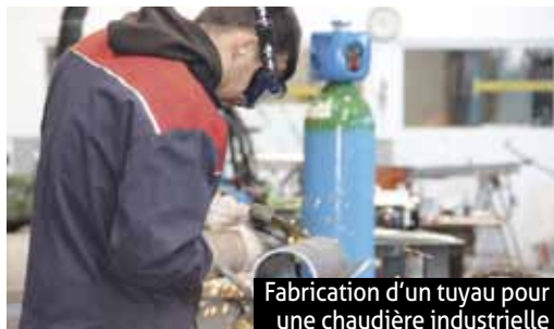
Fabrication d'un tuyau pour une chaudière industrielle