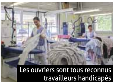
Les ouvriers sont tous reconnus travailleurs handicapés

5 Rue de l'Étoile à Lutterbach 03 89 57 47 28 www.sinclair.asso.fr