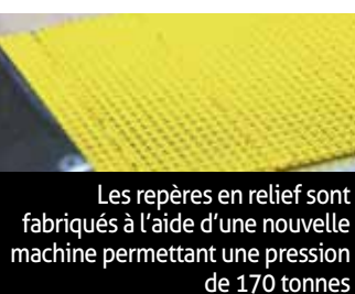
Les repères en relief sont fabriqués à l'aide d'une nouvelle machine permettant une pression de 170 tonnes