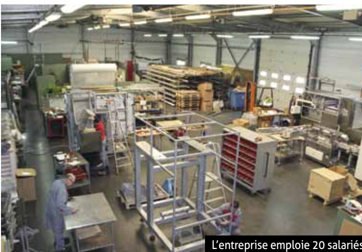
L'entreprise emploie 20 salariés