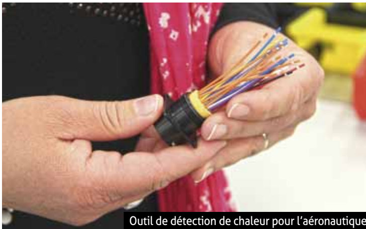
Outil de détection de chaleur pour l'aéronautique