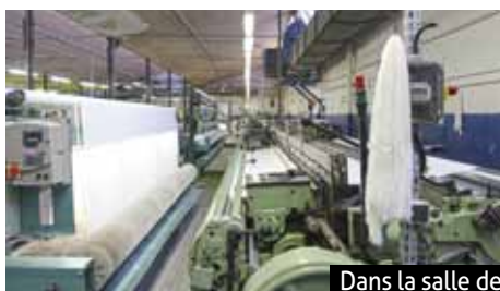
Dans la salle des métiers à tisser