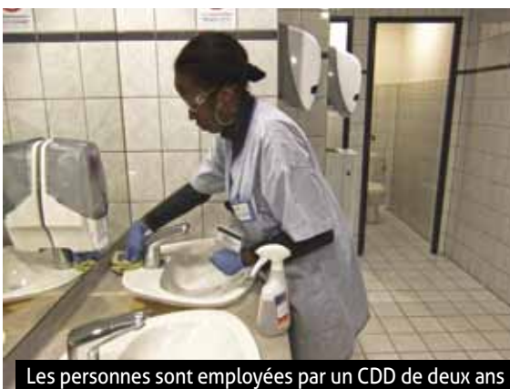
Les personnes sont employées par un CDD de deux ans