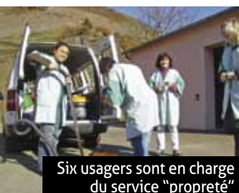
Six usagers sont en charge du service "propreté"