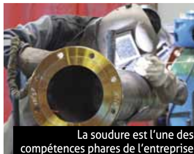
La soudure est l'une des compétences phares de l'entreprise