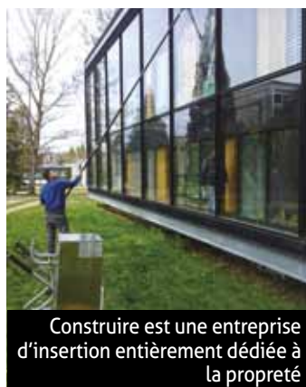
Construire est une entreprise d'insertion entièrement dédiée à la propreté