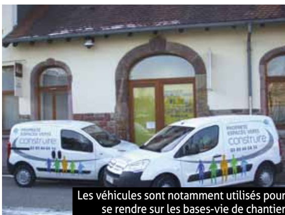
Les véhicules sont notamment utilisés pour se rendre sur les bases-vie de chantier