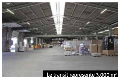
Le transit représente 3.000 m²

Ziegler France SA 1 quai de Rotterdam à Illzach 03 89 61 54 87 www.zieglergroup.com