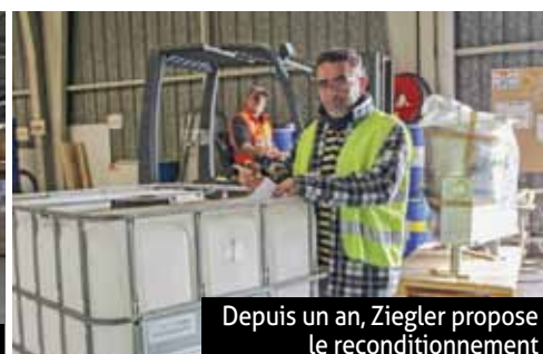
Depuis un an, Ziegler propose le reconditionnement