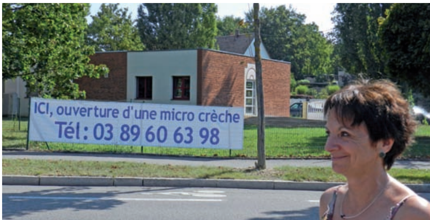
Brigitte Kuntz, Directrice

Les micro-crèches de la Mer Rouge créées par l'ASAME peuvent accueillir jusqu'à 20 enfants simultanément dès cette mi-septembre, une solution pratique pour les salariés du secteur. A fin août, 36 dossiers de pré-inscription étaient déposés, sur une période de plusieurs mois. Des inscriptions peuvent encore être effectuées.